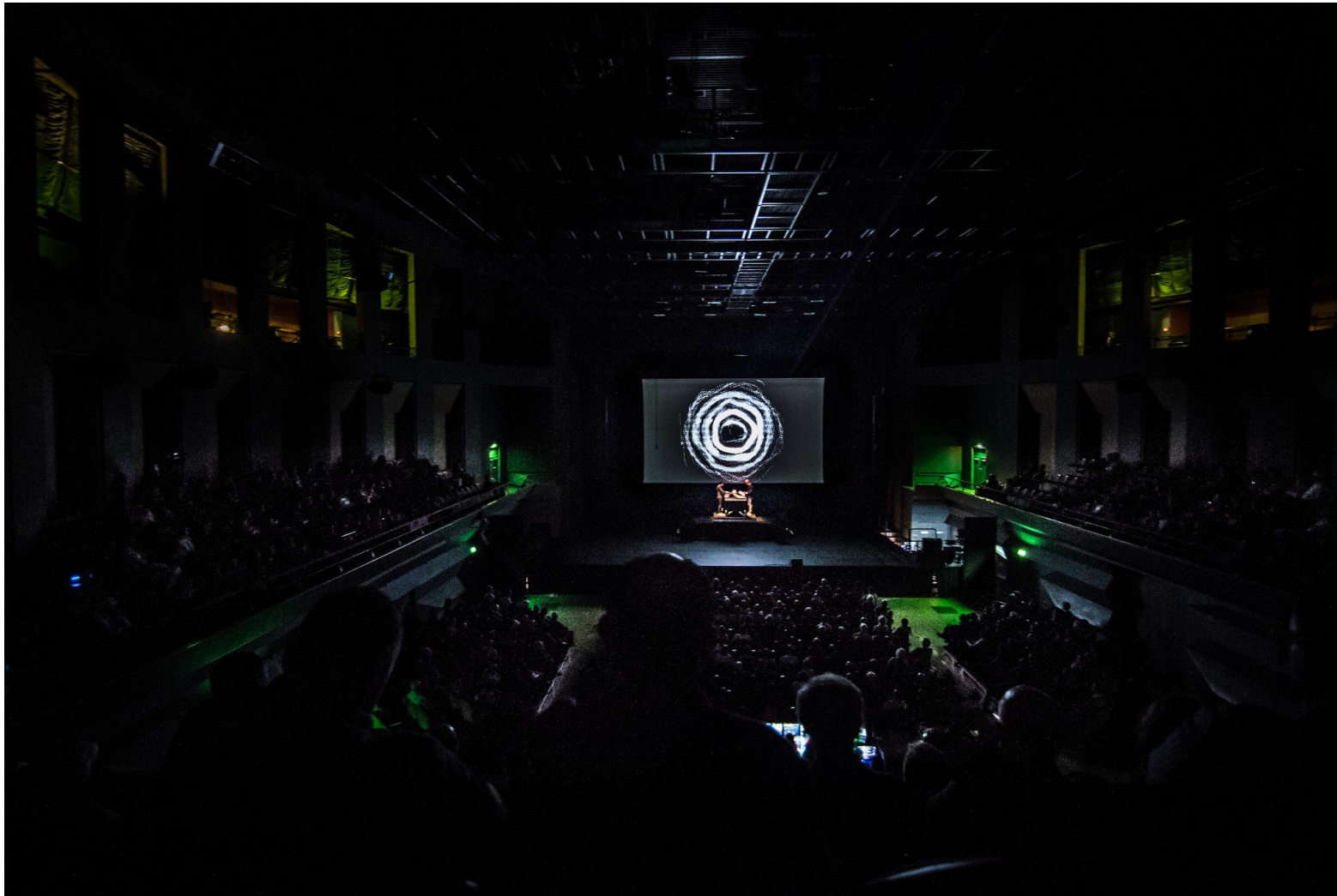
Photo : Vigroux & Schmitt Tempest AV performance Philharmonie de Paris 2015

Production compagniedautrescordes@gmail.com